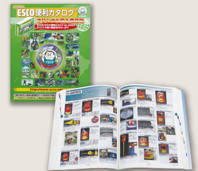
オリジナル輸入商品版