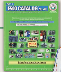
英文カタログ発刊