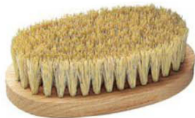
123002 0120：小判型バキンブラシ 120 EA109KC-5