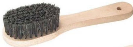
123003 0000：お玉型ブラシ EA109DE-1