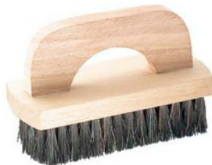
123004 0000：角型マークスリー EA109DE-1