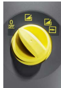
シンプルなダイヤル操作

面倒な設定が不要の使いやすい設計です。100V対応なので、汎用性にも優れます。本体には電源コードとノズルを収納するホルダーが付いているので、コンパクトに収納できます。