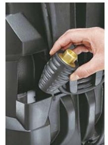
収納に便利なホルダー付き