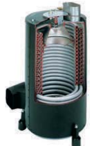
(ヒートコイル: 3年保証) ステンレス製ヒートコイル