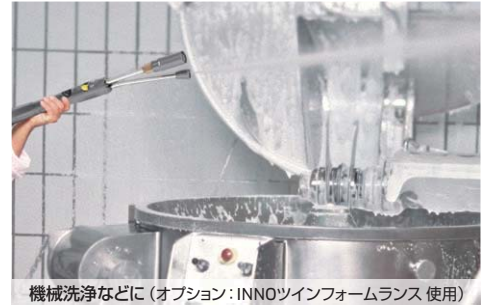
機械洗浄などに(オプション: INNOツインフォームランス 使用)