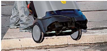
大型タイヤで段差の移動も楽々

大型タイヤ付で、段差の移動も楽に行えます。場所を取らない縦置き型のため収納性にも優れています。また、移動の際は、バンタイプ車で持ち運び可能です。