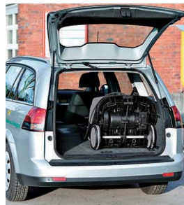
バンタイプ車で持ち運びが可能