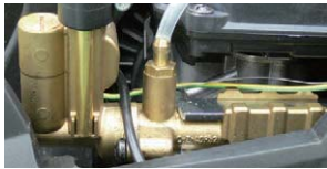
高い耐久性の真ちゅう製シリンドラーヘッド

ボイラーはステンレス製のヒートコイルを採用し、高い耐久性と効率の良い低燃費を実現しました。また、シリンドラーヘッドは高い耐久性を誇る真ちゅう製です。本体も移動や衝撃に耐えられる頑丈な設計です。