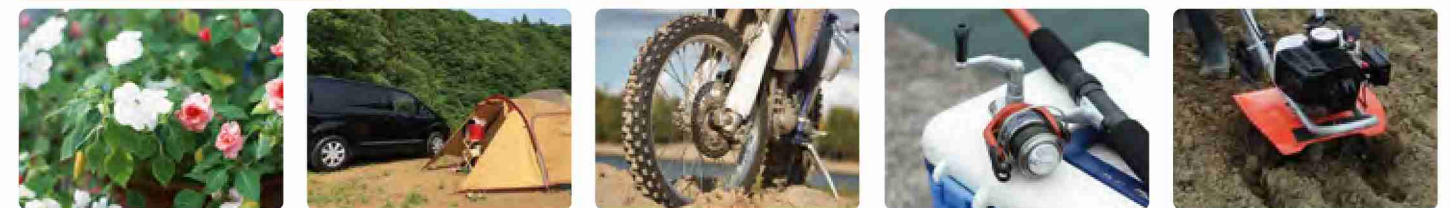
お庭のお手入れに キャンプ用品の洗浄に バイクの洗浄に 釣り具の洗浄に 農機具の洗浄に