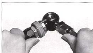
②ホースラインが直線になるまでスイング