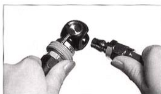
①ニップルをカップリングに差し込み