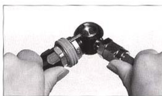
②ホースラインが直線になるまでスイング