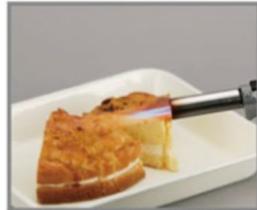
ケーキの焦げ目付け