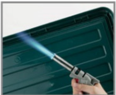
樹脂製品のバリ取り