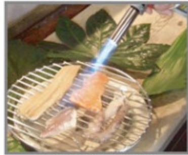
寿司ネタのあぶり