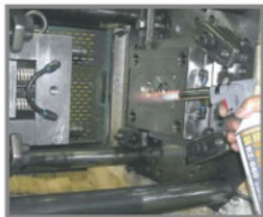
金型に付着した樹脂の除去