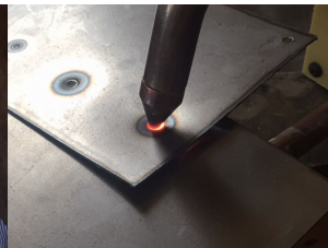
火花が飛びづらい安心構造