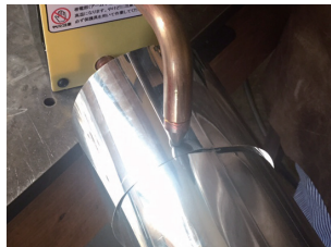
シートメタル溶接に