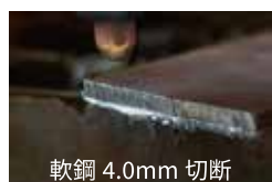
軟鋼 4.0mm 切断

入力 100V23A のため、軟鋼 4.0mm まで良好切断可能です。 100V15A コンセント (家庭用コンセント) では、板厚 0.5mm ~ 3.2mm までのカットが可能です。