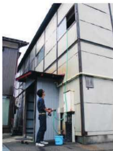
2階までラクラク給水