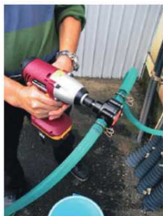
電動ドリルに取り付けて