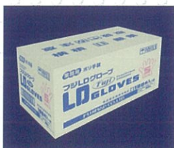
外箱サンプル画像

本品は食品衛生法・食品、添加物等の規格基準第3のD器具若しくは容器包装またはこれらの原材料別規格（昭和34年12月28日厚生省告示第370号及び平成18年3月31日厚生労働省告示第201号）に適合しています。