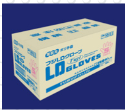
外箱サンプル画像

本品は食品衛生法・食品、添加物等の規格基準第3のD器具若しくは容器包装またはこれらの原材料別規格（昭和34年12月28日厚生省告示第370号及び平成18年3月31日厚生労働省告示第201号）に適合しています。