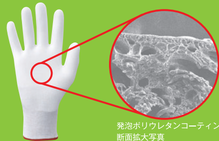
発泡ポリウレタンコーティング 断面拡大写真