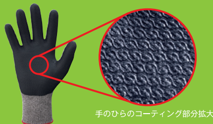
手のひらのコーティング部分拡大