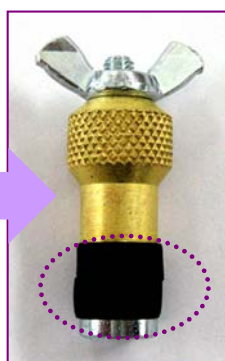
ゴム部分が押され 少し広がりますので 管にピッタリフィット！