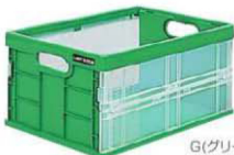
G(グリーン) 96772 9