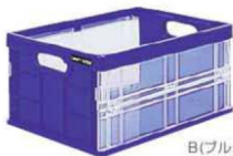
B(ブルー) 96771 2