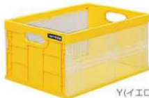
Y(イエロー) 96773 6