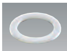
パッキン(ポリエチレン発泡体)