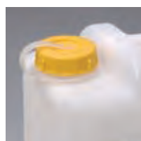
カラーキャップ取付例