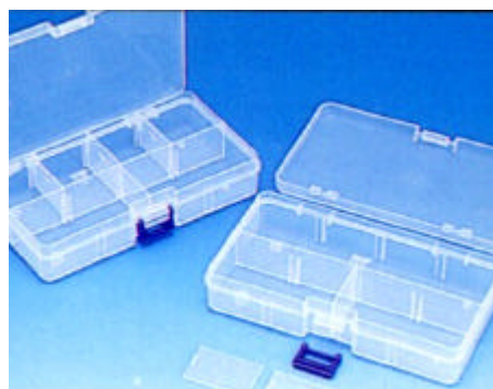
蝶番・バックルは全て別部品使用