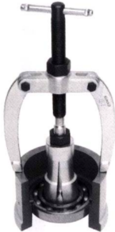
内抜きエクストラクター No.21と支えアームNo.22を セットしたもの