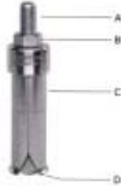
内抜きエクストラクター