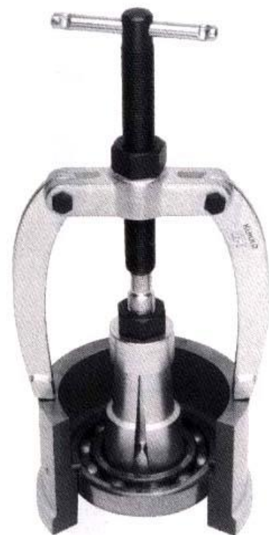
内抜きエキストラクター No.21と支えアームNo.22を セットしたもの