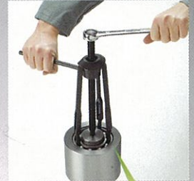
ロックンクック構造

ベアリングに応じた適切なプーラーボルトとプーラーアームを選択し、プーラーアームをベアリングの内外輪の間にフックしてプーラーボルトに固定します