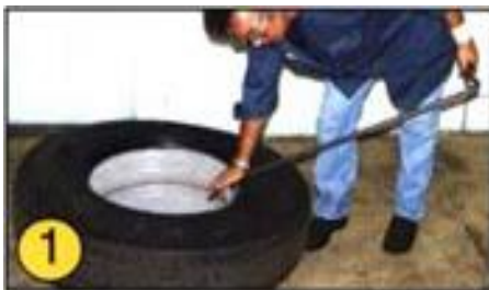
① ツールの大きい方のエンドを 反対のビードに届くまで深く 差込みます。