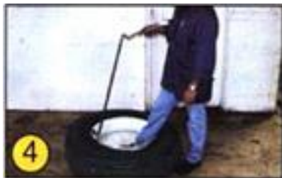
④ 図のようにツールをホイールの 中心に持ち上げます。 均等な力でツールを反対側に 押し下げます。