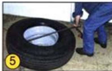
⑤ 図のようにビードを外していきます。