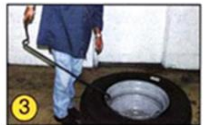
③大きい方を持ち上げます。