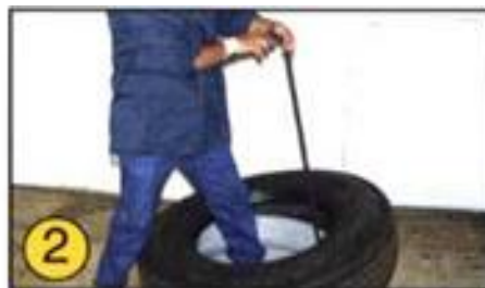
② 図のようにツールをホイールの 中心に持ち上げ均等な力で ツールを反対側に押し下げます。