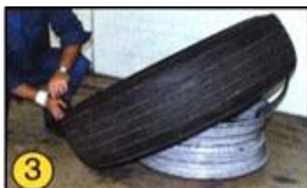
③ ビードが十分に取れない時は 図のようにツールを差込んで、 外してください。