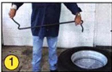
①のようにツールを持ちます。