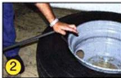
②指を挟まないように小さい方を リムとビードの間に差し込みます。