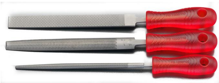
平・半丸・丸3本セット