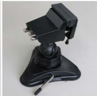
③吸盤が平面部にしっかりくっついているか確認して下さい。