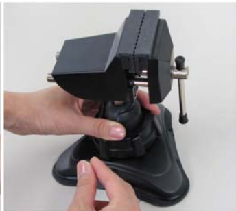
②本体を上から押さえながら、レバーを左側に倒します。