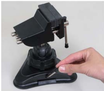
①レバーを立てます。