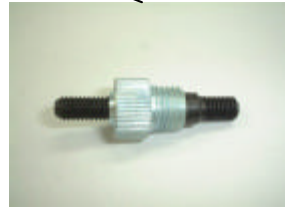
プッシュ&マンドレル (6mm) EA527NK-6B