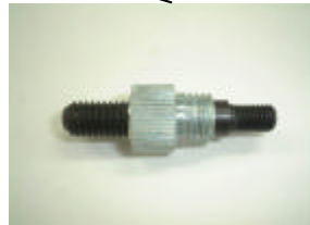
プッシュ&マンドレル (8mm) EA527NK-8B