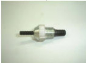
プッシュ&マンドレル (4mm) E A527NK-4B