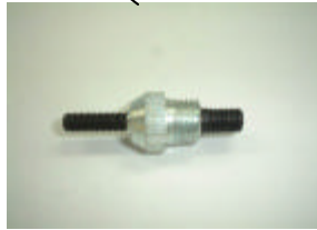
プッシュ&マンドレル (5mm) EA527NK-5B