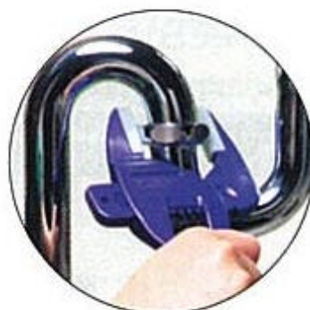
トラップ管使用例 (商品カラーは実際と異なります)