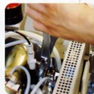
機械整備、手の届かない作業に