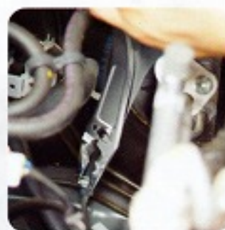
自動車・農機具などの整備に