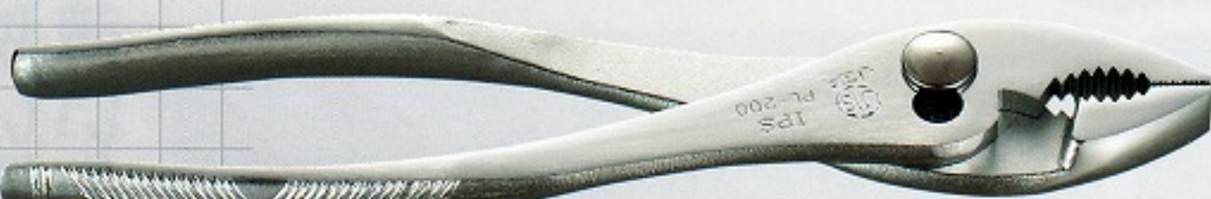
JIS PL-200 JIS B 4614 認証番号 JQ 0308053