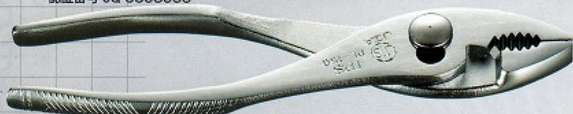
JIS PL-150 JIS B 4614 認証番号 JQ 0308053