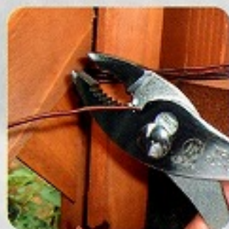
針金や釘なども切れる 軟線で PL-200Sは2.6mm位 PL-150Sは2.0mm位まで