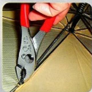
家庭用常備工具として