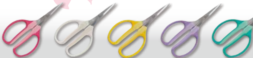
クラフトチョキ(ピンク) FW-330H-P

●高炭素刃物鋼 ●ハードクローム仕上げ ●ソフトグリップ ●ワイヤーカット ●専用キャップ付き