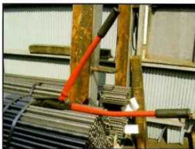
① カッター使用位置