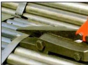
④ 帯鉄が可動刃の内側に入るまで打撃を加える