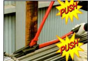
③ ストライカーを前後に操作し数回打撃する