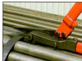
⑤ ハンドルを縮小させた状態で切断操作