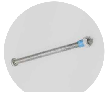
切断後、面取り不要