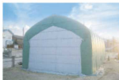
パイプ車庫・サイクルハウス