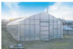
ビニールハウス・温室

用途 ビニールハウス・パイプ車庫の組立・解体、野生動物侵入用電気柵の設置（ガイシの取り付け）など、その他蝶ネジ・蝶ボルトの締め緩めに最適です。