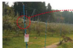
電気柵(野生動物進入防止用)