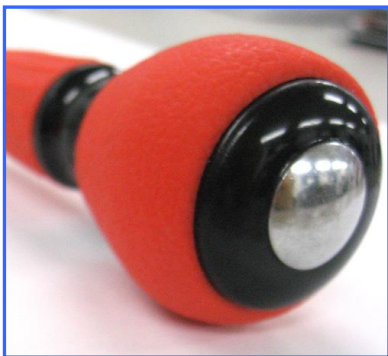
ハンドル末端部に打撃ポイント付