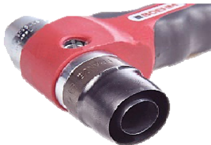
図1 ポンチの取付け例

コンパスカッターを本体に差し込んで、センターピンをポンチ取付部分にセットすれば、コンパスとしての使用ができます。(図3)