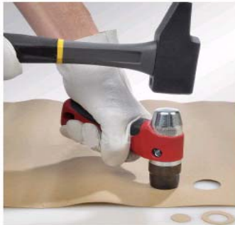
図2 パッキンの作製例