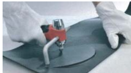
図3 コンパスカッターの使用例 (EA576F-31Bのみ)