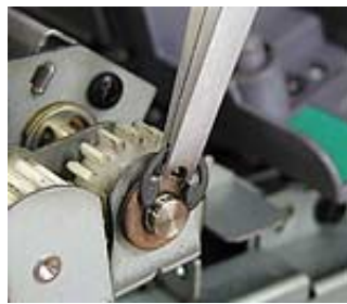
オフィス機器のメンテナンスに