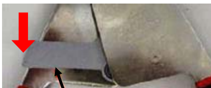
ラチェットロック リリースレバー