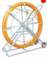
(200・300m用リール) φ 9mm・φ 11mm