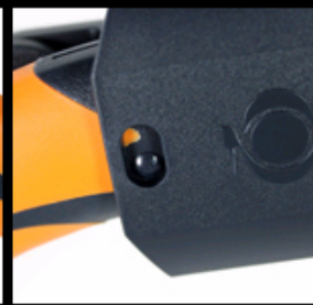
落ちない！耐久ロック機能