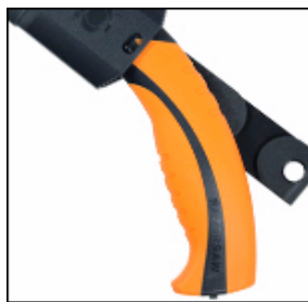
軽量パワーフィットグリップ