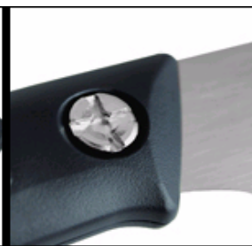
ネジ一つで楽々替刃交換