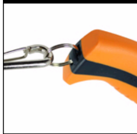
落下防止ストラップ取付穴