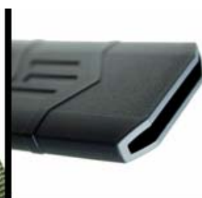
詰らない！ゴミ抜き穴