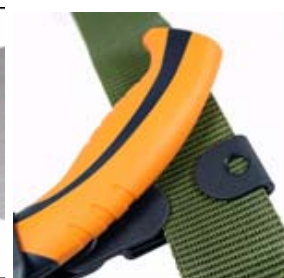
脱着簡単！ベルトフック