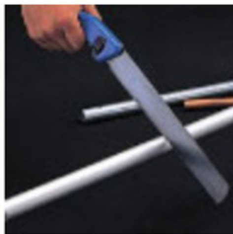
金属パイプ切断作業