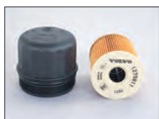
VOLVOのオイルフィルタキャップと交換用ろ紙

熱膨張が発生する樹脂製オイルフィルタカバーに対応するため、AVSA-074C及び087は通常タイプより全長を長めにし、オイルフィルタとの掛かり代を大きくとり、熱膨張時でもしっかりフィルタに掛かるように設計されています。