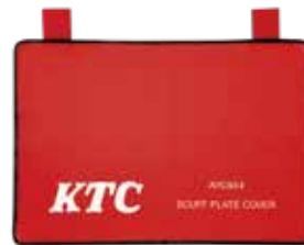
スカッププレートカバー No.AYC404