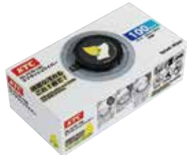
スプラッシュワイパー No.YCW-100