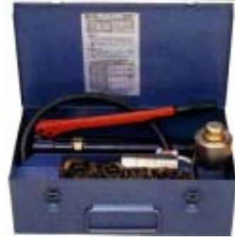
スチールケース付

配電盤、制御盤および各種部品の取付け口等の 穴あけに使用します。 仕上がりがきれいで操作も極めて簡単です。