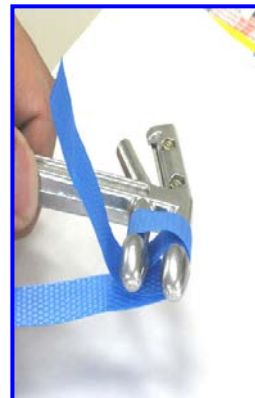
③. ①と②の折り返しでできた2個の輪にツールを差込む。