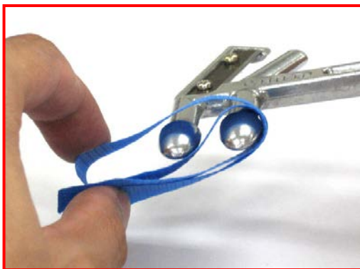
③. ①と②の折り返しでできた2個の輪にツールを差込む。