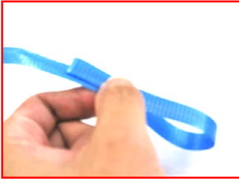
①バンドを折り返して輪を作る