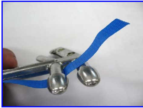
①バンドをツールの間に下から通す。