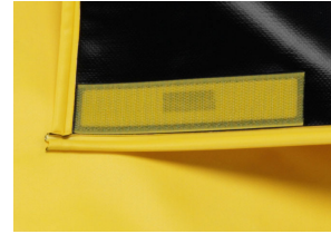
四隅にマジックテープ付