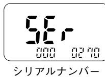
シリアルナンバー

シリアルナンバー (機器個別番号) を内部に記憶し、電源投入時に表示します。 (SK-270WP-Bのみ、キー操作で表示) ケース表面にシール貼付がないため、食品検査時に異物混入などの恐れがありません。