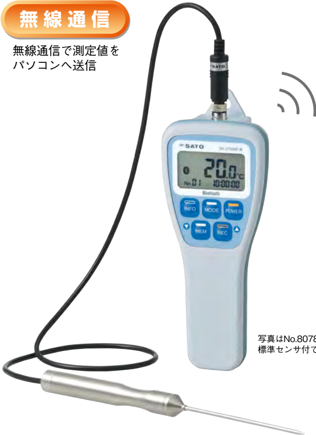
写真はNo.8078-60 標準センサ付です