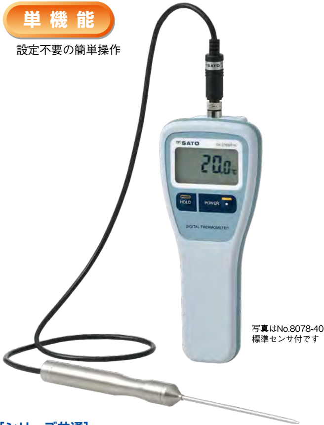
写真はNo.8078-40 標準センサ付です