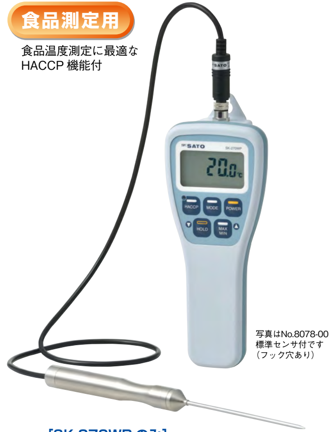
写真はNo.8078-00 標準センサ付です (フック穴あり)