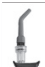
自在型アタッチメント (AT-2G)