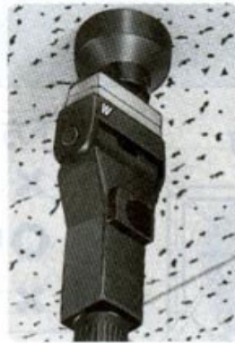
ランプソケットに