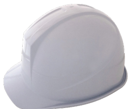
アメリカンタイプ